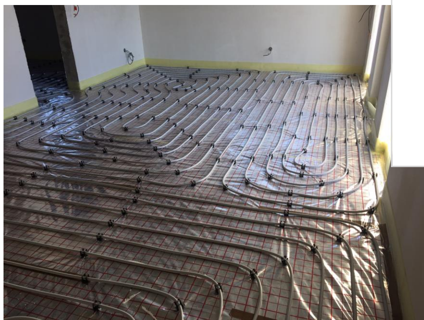
PŘÍCHYTKY A TACKER SMARTCLIP